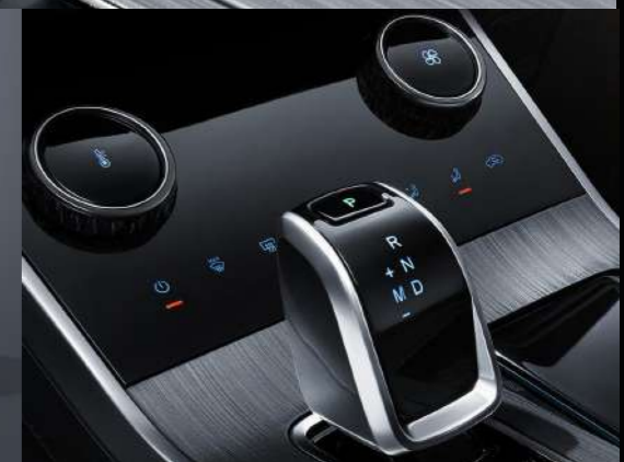
Palanca de cambios tipo Joystick